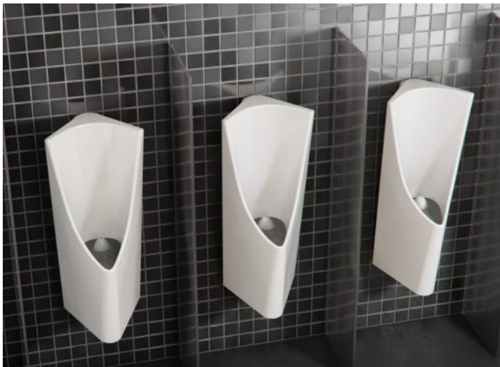
Stuktura - Jacob Delafon