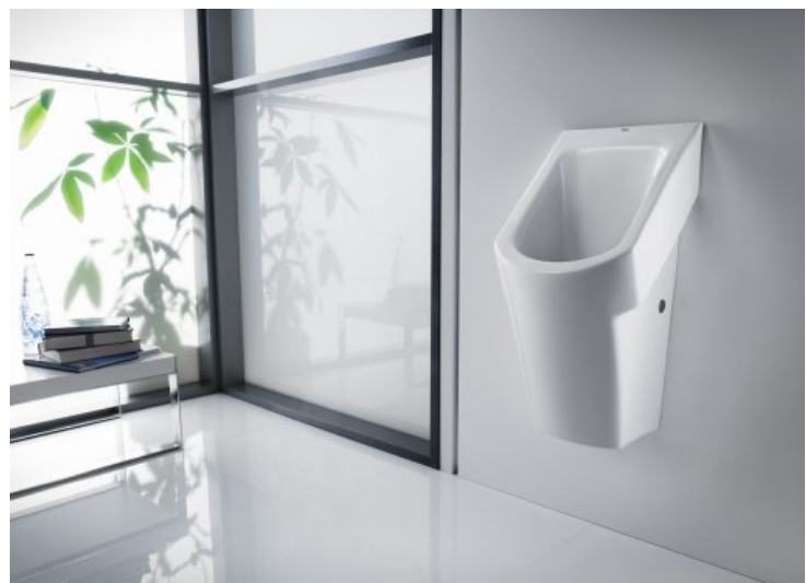
Hall - Roca

Duravit - - Roca - Laufen - Jacob Delafon