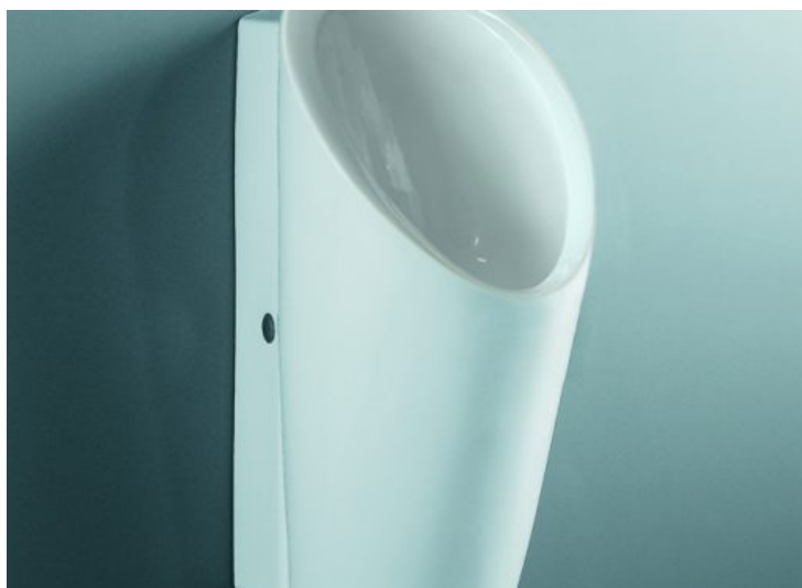
Lema - Laufen

Duravit - - Roca - Laufen - Jacob Delafon