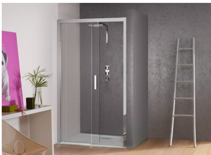
Kinespace C - Kinedo