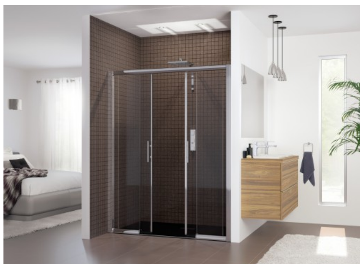
CLASSIC - Kinedo