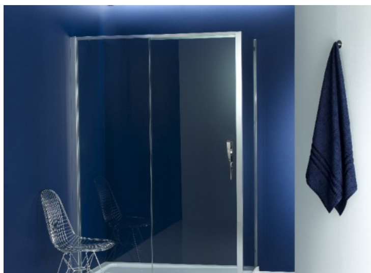
Torsion - Jacob Delafon