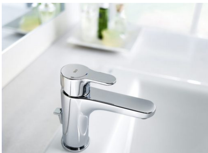
L20 - Roca