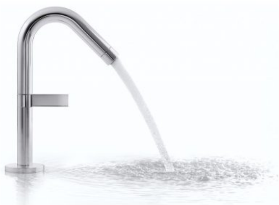
Stillness - Jacob Delafon