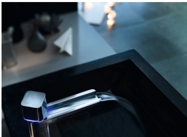
LOOP E - Nobili