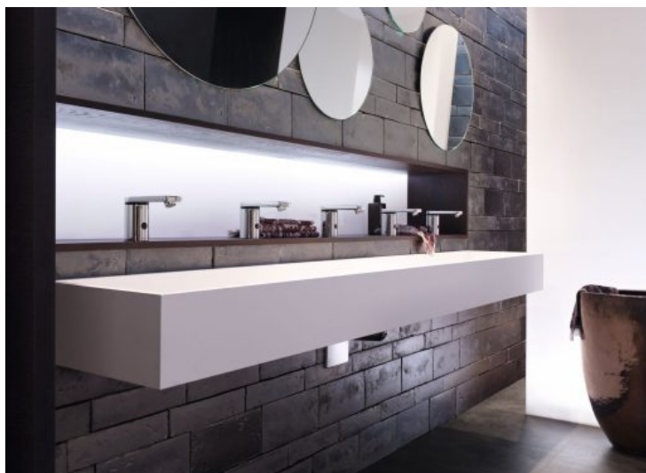
Robinetterie - Geberit