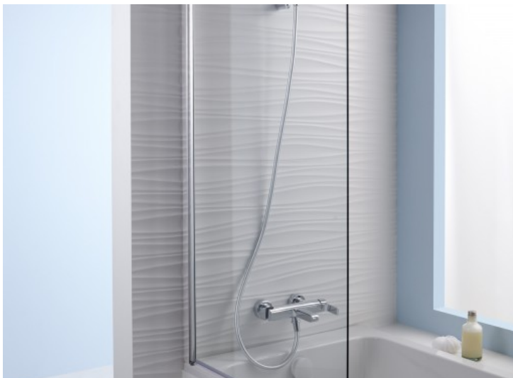
Struktura - Jacob Delafon