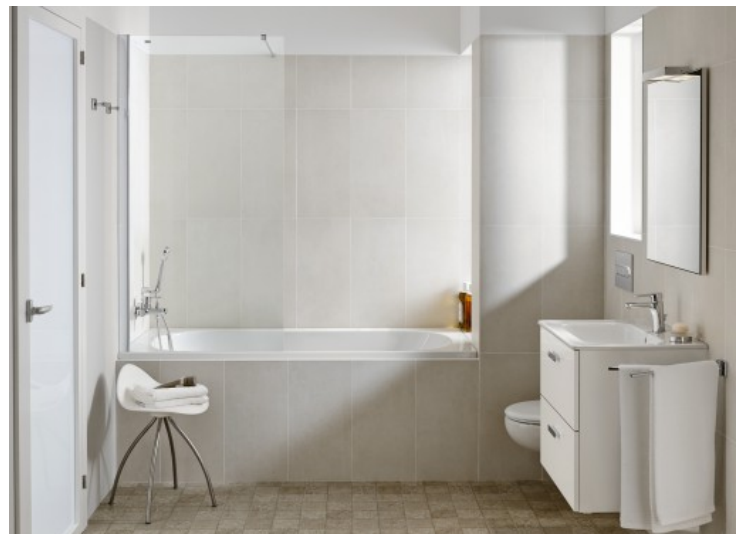
Victoria - Roca