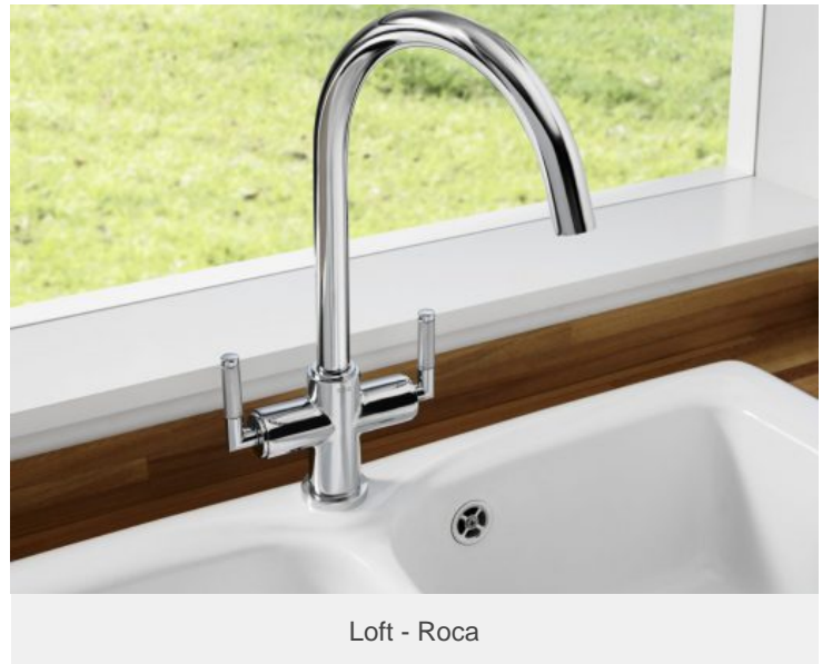
Loft - Roca