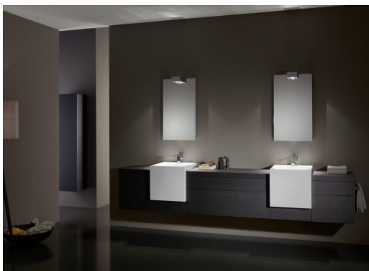
A system addit - Alape