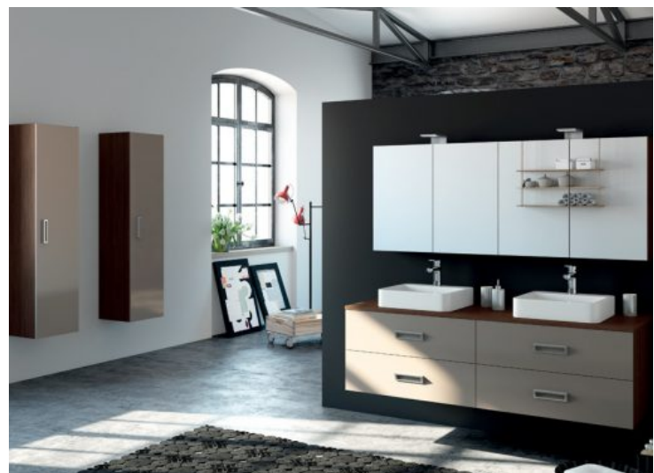
ORMEA - Aquarine