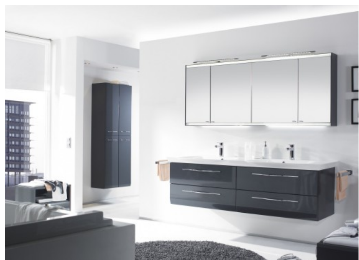
Vialo - Alape

Alape - - Villeroy & Boch - Roca - Laufen - Aquarine - Jacob Delafon - Allibert - Ambiance Bain