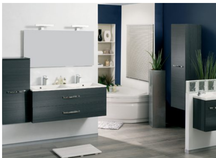
ADEPT - Allibert