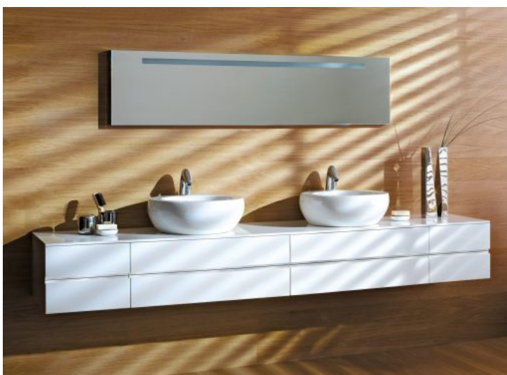
Ilbagnoalessi one - Laufen