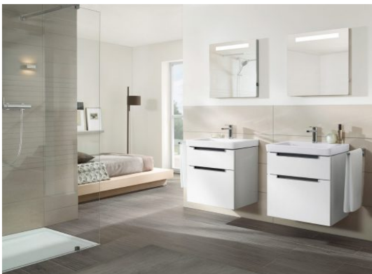
Subway 2.0 - Villeroy & Boch