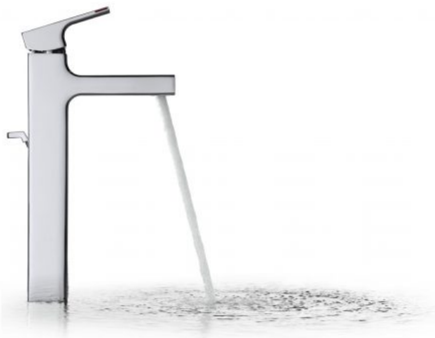
Strayt - Jacob Delafon