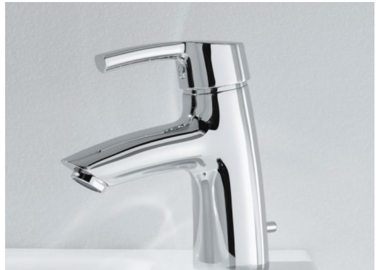
Curvepro - Laufen