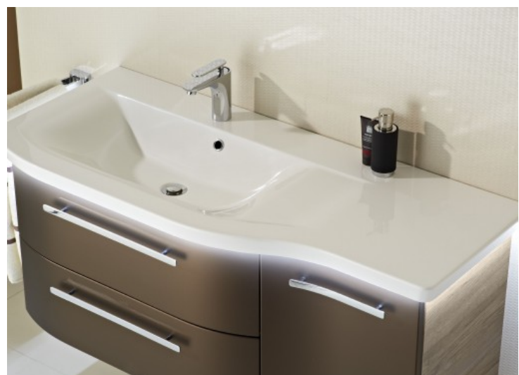
Contea - Alape