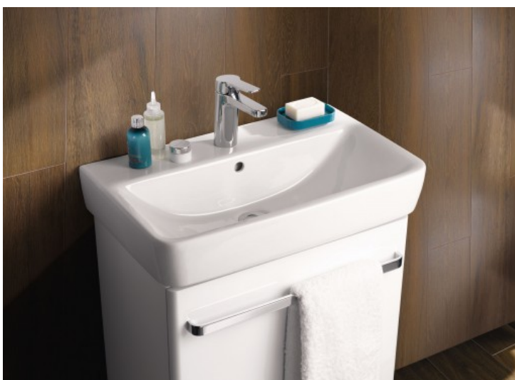
Prima Style Compact -