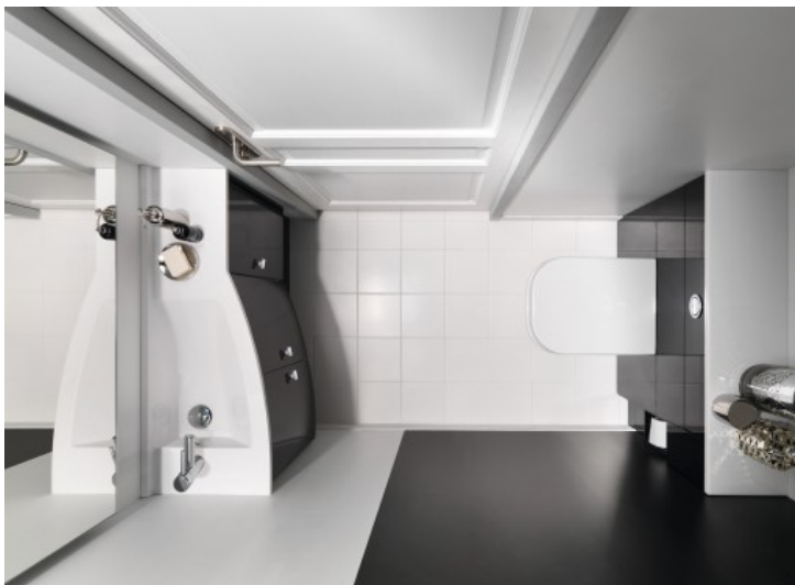
YOKO - Ambiance Bain