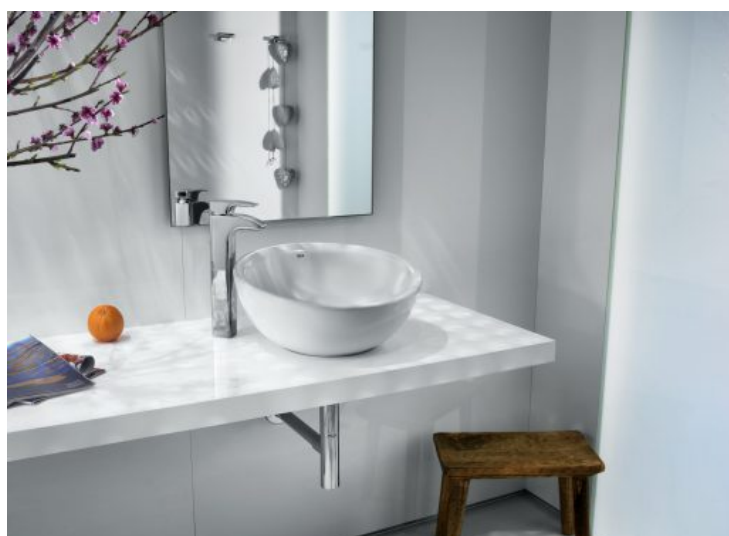
Bol - Roca