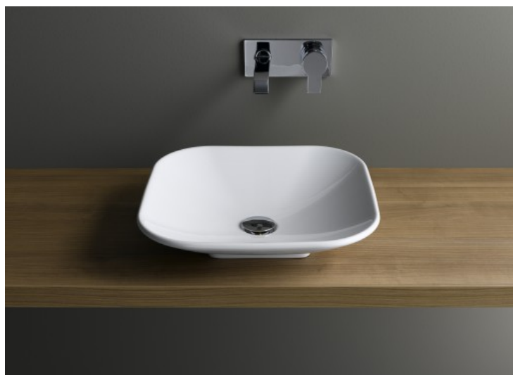
Options - Vitra