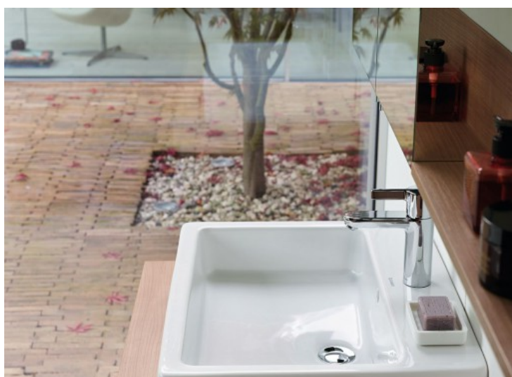
Vero - Duravit