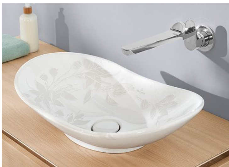
My Nature - Villeroy & Boch