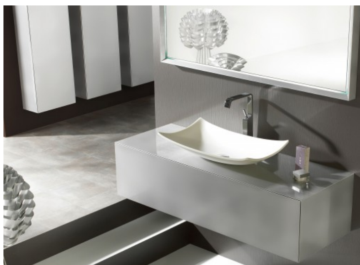
Eden - Ambiance Bain