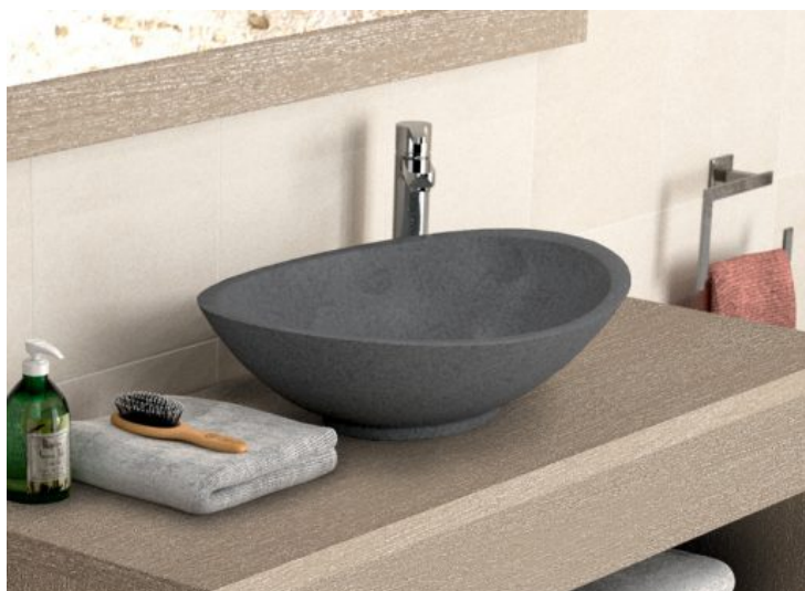
MILFORD - Aquarine