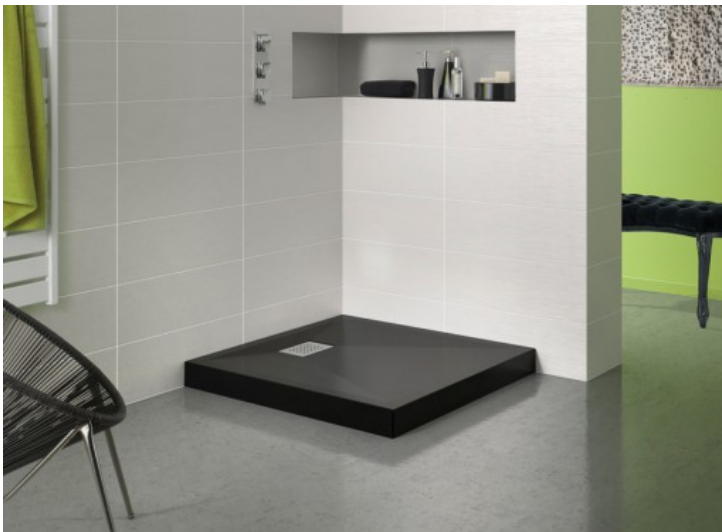
Kinecompact C90N - Kinedo