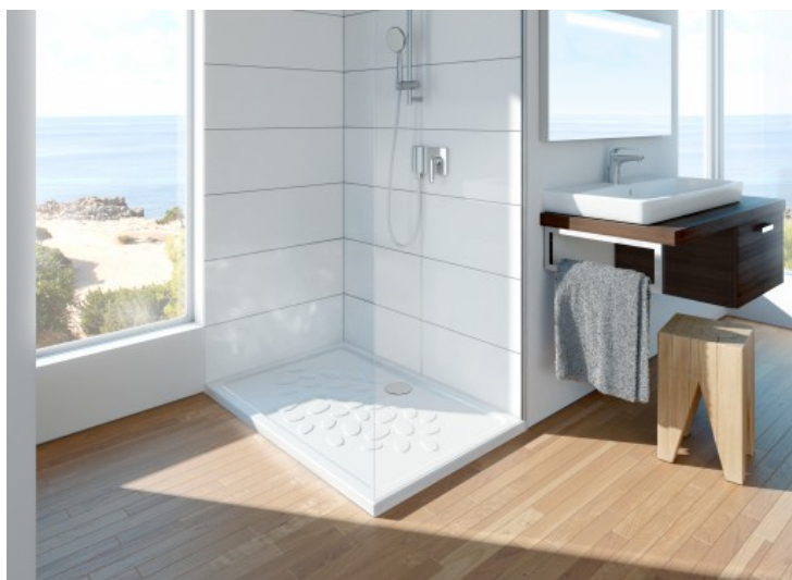
Ocean - Vitra