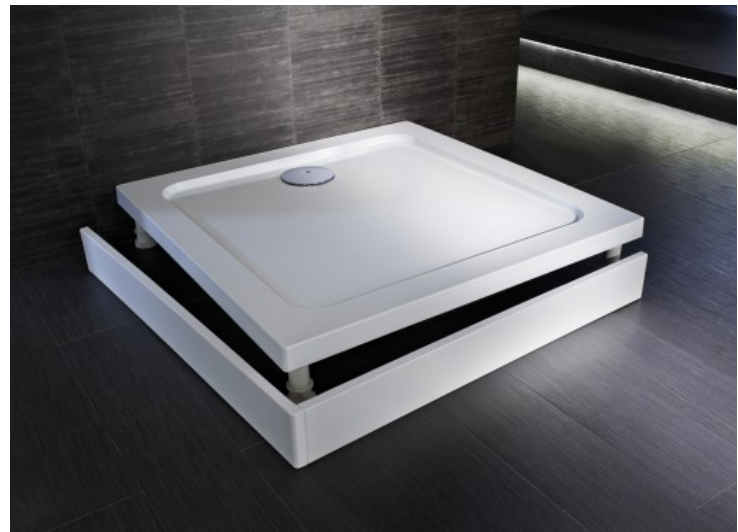
Flight - Jacob Delafon