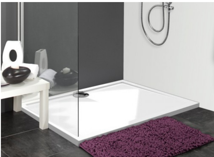
POLYBETON - Allibert