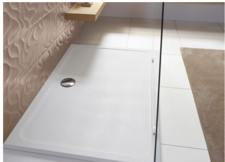
Lifetime - Villeroy & Boch

Ambiance Bain - - Vitra - Jacob Delafon - Villeroy & Boch - Leda - Roca - Kinedo - Laufen - Aquarine - Allibert