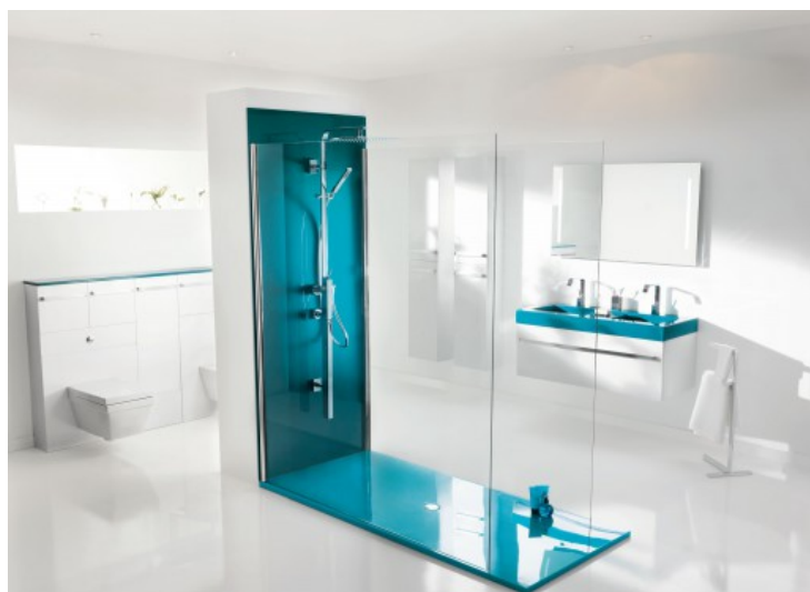
Waterconcept - Ambiance Bain

Ambiance Bain - - Vitra - Jacob Delafon - Villeroy & Boch - Leda - Roca - Kinedo - Laufen - Aquarine - Allibert